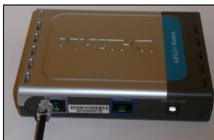
Csatlakozó bedugása az ADSL Modem „ADSL” feliratú aljzatába