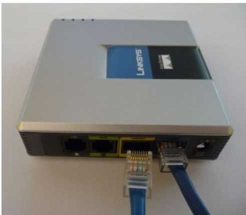
RJ45 Ethernet hálózati kábel a LINKSYS Router „ETHERNET” aljzatába helyezése