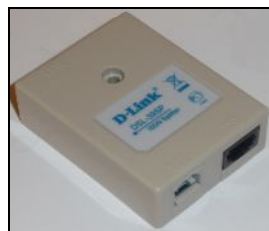
Szűrő - Splitter