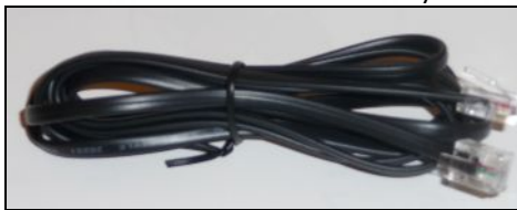
RJ11 telefonkábel (fekete színű)