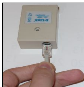
Csatlakozó bedugása a szűrő „LINE” feliratú aljzatába