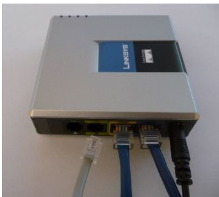
RJ11 telefonkábel a LINKSYS Router „Phone” aljzatába helyezése