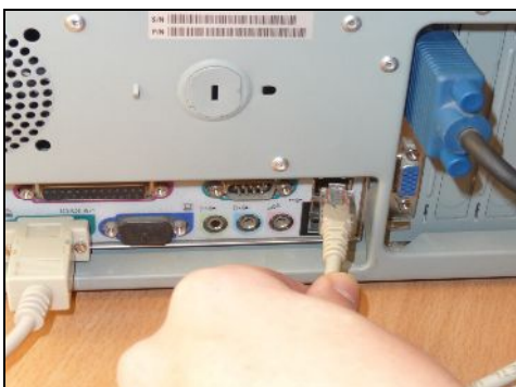
RJ45 Ethernet hálózati kábel a számítógép Ethernet aljzatába helyezése