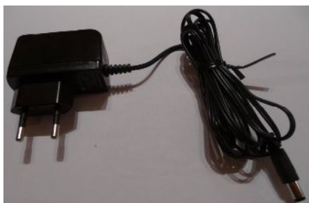
220 v-os hálózati adapter