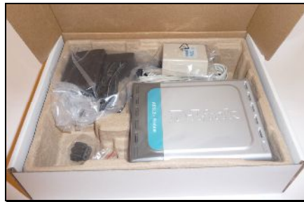
Modem doboz kinyitva