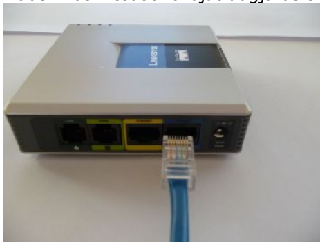
RJ45 Ethernet hálózati kábel a LINKSYS Router „INTERNET” aljzatába helyezése