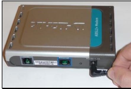
220 V-os adapter ADSL Modembe való csatlakoztatása

11. A 220 V-os hálózati adapter segítségével helyezze áram alá az ADSL Modemet.