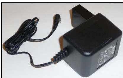
220 v-os hálózati adapter