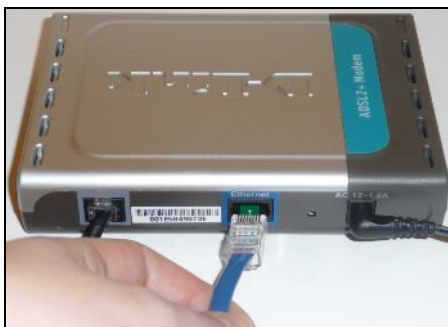
RJ45 Ethernet hálózati kábel az ADSL Modem „Ethernet” aljzatába helyezése