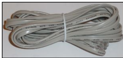
RJ11 telefonkábel (szürke színű)