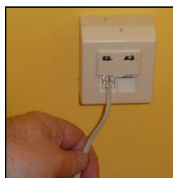
Csatlakozó bedugása a fali aljzatba