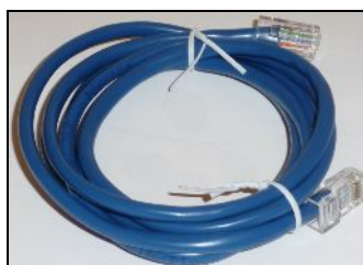
RJ45 Ethernet hálózati kábel (kék színű)