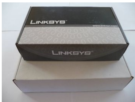
A postán kapott csomag tartalma

Kérem ellenőrizze, hogy az alábbi eszközök mind megtalálhatóak –e az Önnek küldött csomagban!