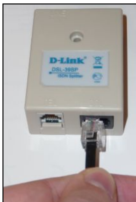
Csatlakozó bedugása a szűrő „DSL” feliratú aljzatába