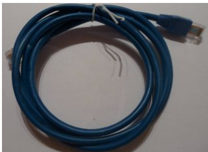
RJ45 Ethernet hálózati kábel (kék színű)