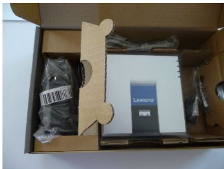
LINKSYS Router doboz kinyitva