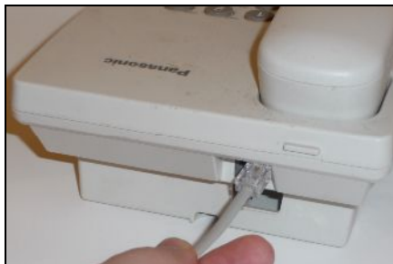
RJ11 telefonkábel csatlakozásának ellenőrzése