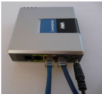
220 V-os adapter LINKSYS Router -be való csatlakoztatása